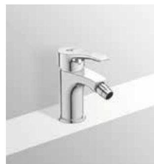
011 033 021 Miscelatore Monocomando Bidet Alpha Ideal Standard BC652AA con Scarico 104,70