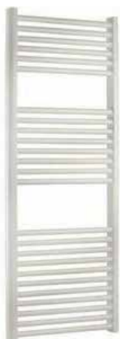
014 109 002 Termoarredo Bianco Lisa 22 450X700 H700L450I400 Cordivari Wat 282