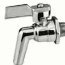
006 165 068 Rubinetto Enologico Sfera Acciaio Inox Aisi 316 D.3/8 Leva