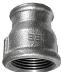
001 098 258 Raccordo Ghisa Zincato Manicotto Ridotto FF Fig.240 D.1'1/2x3/4 8,900