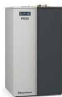
022 047 081 Caldaia a Pellet Extraflame PX 30 Kw 30 H2o Kw 30 A+