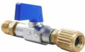
030 186 064 Rubinetto Con Depressione 1/4" M-5/16" F(B) 934099 MGF