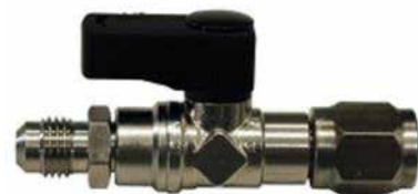
030 186 068 Rubinetto Depressione 1/2" Acme Sx F-5/16" M 934072 MGF