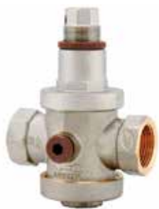
006 165 110 Riduttore di Pressione Europress Itap Acqua Linee 25bar D.1/2 FF 41,800