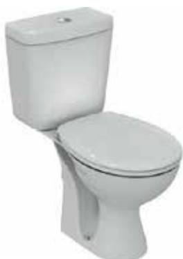
024 033 081 Vaso Cassetta Quarzo Filo Pavimento Scarico a Pavimento Bianco Ideal Standard cod.E8847 477,80