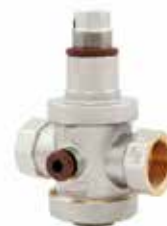
001 165 110 Riduttore di Pressione Europress Itap Acqua Linee 25bar D.1/2 FF