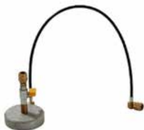
030 186 052 Supporto Bombele 5/16" 930998 MGF