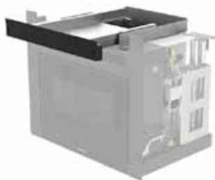
022 047 076 Kit Cassetto Caricamento Pellet Frontale L80 L=300 Extraflame