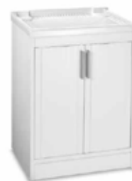
017 084 082 Mobile Lavatoio in Acrilico Resina Avant Standard L60xP60xH84 Ante 2 182,900