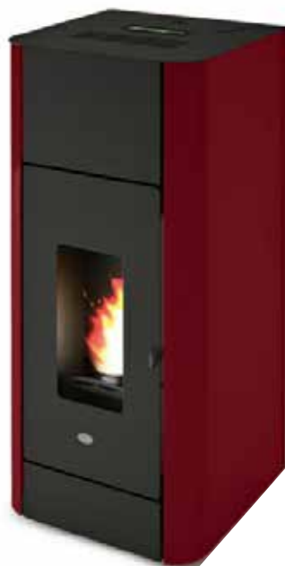
022 043 020 Stufa Idro Hydro Frida 17 Rosso o Tortora Eva Calor