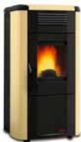
022 047 021 Stufa ad Aria a Pellet Extraflame Viviana Evo Pergamena Kw 10,2 A+