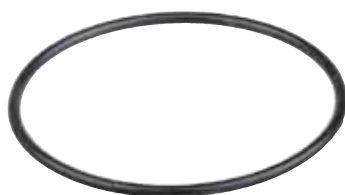
007 011 014 O-Ring 92x4mm HL 2,000