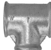
001 098 285 Raccordo Ghisa Zincato Tee Ridotta Femm.Femm.Fig.130R D.3/4x1/2 3,400