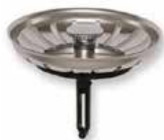
007 124 066 Cestello Accessori per Piletta Tappo Omp D.51 Cod.137.079.0 8,100