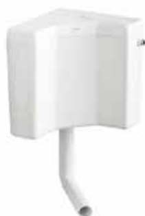
009 034 025 Cassetta a Zaino Coibentata Corner Angolo Funzione Start-Stop SCHWAB 101,60