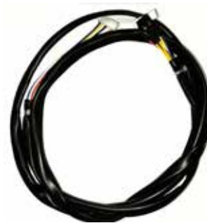
012 188 013 Cavo Collegamento Motore Spostamento Attacchi idraul. Sx/Dx BB0646II 38,400