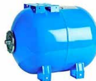
002 071 051 Idrosfera a Membrana Intercambiabile Attacco D.1" It 100 Orizzontale