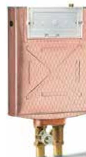
009 076 008 Cassetta Incasso Pucci Rame 10Lt-1 Lt Doppio Pulsante 50321040 con Canotto 351,20