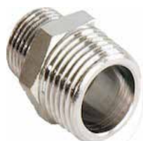
001 170 330 Raccordo Ottone Cromato Niples Ridotta Maschio Maschio D.1'1/4x1" 5,600