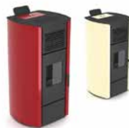
022 043 012 Stufa ad Aria a Pellet Eva Stampaggi Nicole Rosso/Avorio Kw 15