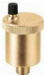
019 091 004 Valvola di Sfogo Aria Automatica a Galleggiante Diritta D.3/8 Apm 7,20