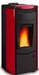
022 047 045 Stufa Idro Extraflame Melinda Idro Steel Bordeaux Kw 14,2 H2o Kw11,7