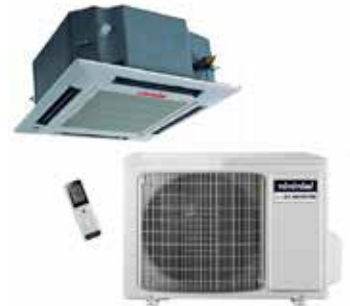
023 185 057 Climatizzatore Toyotomi Cassette 24000 Btu Monospit CCT71IUNVR32 4181,600