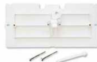
009 076 040 Ricambi Pucci Sara Sportello Completo 80006240 C/2Vite Registro D.M8 21,20