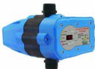
002 048 001 Sistema di Controllo Elettropompa Automatico Elettronico Hydromatic Pro 2Hp