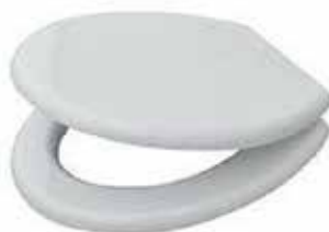
005 175 012 Sedile Universale Chiuso in Legno Vaso Infanzia Poliestire Bianco