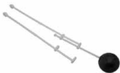
009 076 041 Ricambi Pucci Sara Gruppo Completo 80006261 Sfera con Tirantino Astine 22,50