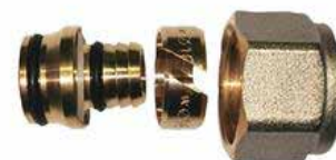
001 167 011 Adattatore Dado Anello Portagomma per Tubo Multist.D.16x1/2x2 RTM 2,100