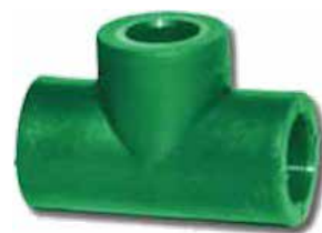
001 022 028 Raccordo PPR Random a Saldare Tee Ridotta Femmina Femmina D.32x25x32 2,50