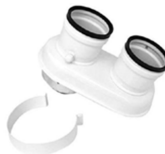
016 139 042 Kit Scarico Sdoppiato 60/100-80+80 3318034 (uscita 2tubi 80) Chaffot. 48,900