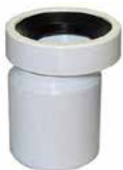
009 022 101 Manicotto Wc Eccentrico PP HTSKC/Guarnizione D.110x16 cm ad innesto 9,600