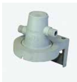
002 087 215 Testa Claris Gen2 Everpure per Catuccia D.3/8 Usc.Ingr.3/8 BSP 4339