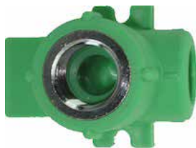
001 022 024 Raccordo PPR Random Saldare Gomito Flangiato Flettato Femm.D.25x1/2 7,20