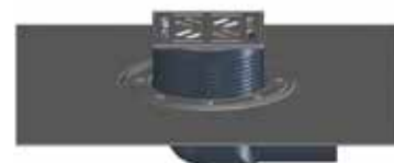
007 011 085 Pozzetto Balconi Terrazzi HL5100TH DN75 Oriz.C/Guain. Bitum. 240,800