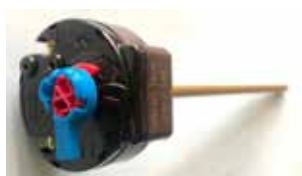
001 107 021 Termostato Scaldacqua 10 Lt Chaffoteaux Themowatt cod.3412386