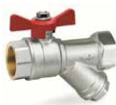
006 165 095 Valvola Sfera a Farfala con Filtro Y Femmina Con Premistop D.1/2