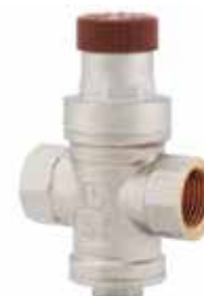
006 165 100 Riduttore di Pressione Minipress Itap Acqua Sotto Boiler 15bar D.1/2