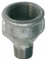
001 098 212 Raccordo Ghisa Zincato Manicotto Ridotto MF Fig.246 D.1'1/2x 3/4 7,300