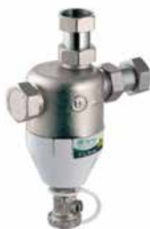
019 146 155 Defangatore Te-Sa con Filtro e Magnete con Valvola, Tappo, Bocchettone D.3/4 FF