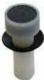
009 076 045 Ricambi Pucci Sara Valvola con Guarnizione 80006555 23,30