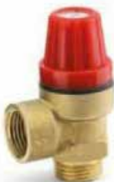
019 141 005 Valvola di Sicurezza Maschio Femmina D.1/2 3 bar Apm 7,30