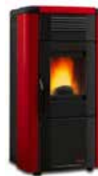
022 047 025 Stufa ad Aria a Pellet Extraflame Viviana Plus Evo Bordeaux Kw 10,3A+