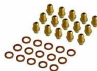
016 139 225 Kit Trasformazione da GPL a Metano Scald.Avenir LNX Lt 11 3632495 35,900