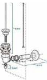
001 156 013 Kit Asta di Comando Completo per Batteria Fait 8.04/C ITS 14,400