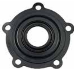
003 101 015 Guarnizione per Resistenza Flangiata Scaldacqua d.75 Egrale 5F180717