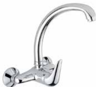
011 129 030 Miscelatore Lavello Parete Canna Superiore Cromo Serie Falco Gaboli 123,600