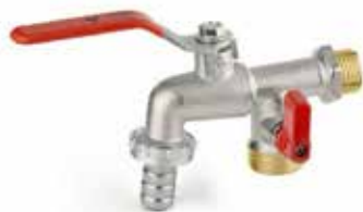
006 165 071 Rubinetto Porta Gomma Doppio e Mini Valvola con Porta D.1/2x3/4x3/4