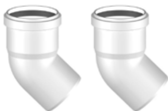
016 139 204 Curva 45° MF per Condensazione D.60 Pz 2 PPS 3318106 55,400