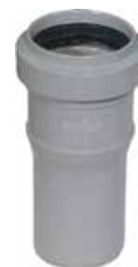
009 022 107 Tronchetto PP-PVC D.125x100 L260 con Attacco Pvc Incollaggio Valsir