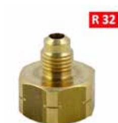
030 186 054 Adattatore 5/16" M Dx 934073 MGF