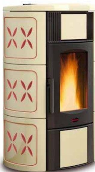
022 047 056 Stufa Idro Extraflame Iside Idro 2,0 Ametista V.A. Kw 19 H2o Kw 15,5