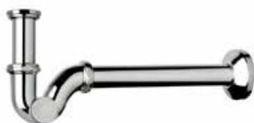
007 124 042 Sifone a U con Rosone Ottone Cromato D.1" Tubo D.26x25 Cm S/Pilet 19,200