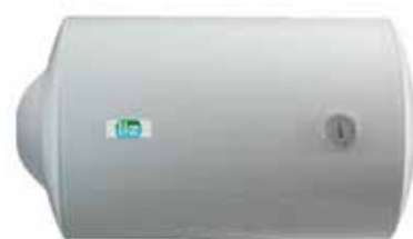
016 073 041 Scaldacqua Termoelettrico Garanzia 2 Anni MRAVEGGI Lt 50 VR TD DX 359,400