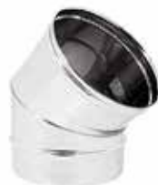
028 104 044 Gomito 30° Acciaio Inox Aisi304 Monoparete S/Guarnizione D.250 29,50