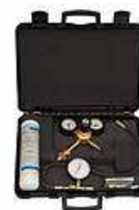
030 186 074 Kit Azoto 1 Lt in Valigetta MGF 934598 D.1/4 Indicazione Pressione