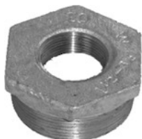
001 098 300 Raccordo Ghisa Zincato Riduzione Maschio Femm. Fig.241 D.2'1/2x1'1/2 12,600