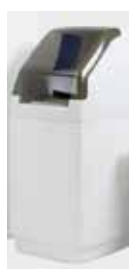
002 087 235 Addolcitore Pentair Riversoft 15 Lt 15 SF01WYW07A368-001 SenzaBypass