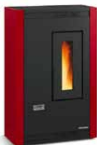
022 047 005 Stufa ad Aria a Pellet Extraflame Luisella Bordeaux Kw 4,4 A+