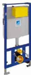
009 034 003 Cassetta Incasso DUPLO 199 SCHWAB Modulo Wc Cartongesso Flusso 3/6 308,80