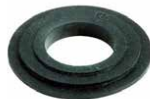
001 156 015 Membrana Chiusura per Unibox 5.11 ITS Todini 1,700