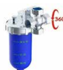
002 093 012 Dosatore Prop.Polifosfato in Polvere Anti Calcare Attacco 360° D.1/2