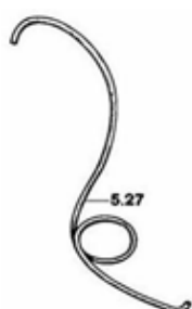
001 156 016 Tubo PVC Flex per Unibox 5.27 ITS Todini 1,100