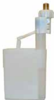
009 076 042 Ricambi Pucci Sara Gruppo Valvola Completa 80006550 43,30