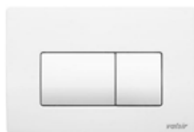
009 022 410 Placca Doppio Scarico Bianco Cassetta Incasso Tropea S Valsir 57,50