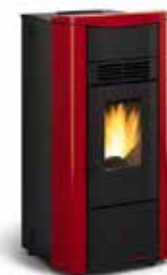
022 047 010 Stufa ad Aria a Pellet Extraflame Giusy Evo Bordeaux Kw 7 A+