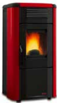
022 047 020 Stufa ad Aria a Pellet Extraflame Viviana Evo Bordeaux Kw 10,2 A+