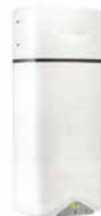
029 139 070 Pompa di Calore Acquanext per Acqua Sanitaria Lt 80 WH Chaffoteau 2793,000