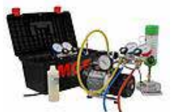
030 186 073 Bauletto System3 Senza Pompa Con Bilanciamento 100 Kg 930311