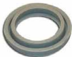
009 076 044 Ricambi Pucci Sara Guarnizione Sede Sfera 80009038 Cf 10 Pz 29,50