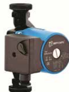
002 071 006 Ricambio di Circolazione Tre Velocità GHN25/70-180 IMP 979521987