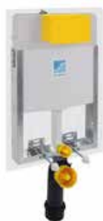
009 034 002 Cassetta Incasso SET 199 SCHWAB Wc Sospeso Doppio Flusso 3/6 L(4-7) 186,90