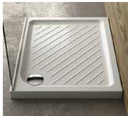
024 033 102 Piatto Doccia square 90x90 H7 Bianco Ideal Standard art.3025401 240,20