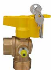
006 100 174 Valvola Gas Post Contatore C/ Presa Press.Serr.Squadro MF D.3/4x1"