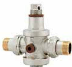
001 165 120 Riduttore di Pressione Europress Itap Linee 25bar D.1/2 C/ bocchettone M.M.