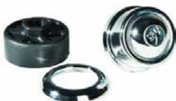
001 156 017 Comando Pneumatico Unibox 5.91 ITS Todini 10,800