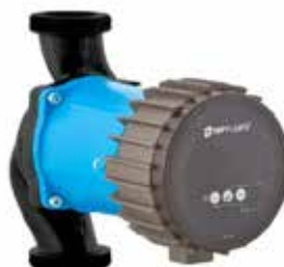
002 071 018 Elettropompa di Circolazione Alta Efficienza NMT SMART 32/80-180 Imp