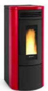
022 047 050 Stufa Idro Extraflame Costanza Idro Bordeaux Kw 17 H2o Kw 12