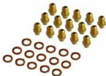
016 139 031 Kit Trasformazione Metano/Gpl Scaldacqua Fluendo 11 LNX 3632502 26,000