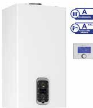
016 139 167 Caldaia a Condensazione Urbia Advance Link 35 Kw FF Metano/Gpl con kit F 4.902,00 016 139 168 Caldaia a Condensazione Mira Advance Link 30 Kw FF Metano/Gpl 3.454,00 016 139 169 Caldaia a Condensazione Mira Advance Link 25 Kw FF Metano/Gpl 3.204,80