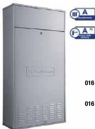
016 139 121 Caldaia a Condensazione Inoa Green IN 25 Kw FF Metano/Gpl Con Kit Fumi 3.235,00 016 139 122 Caldaia a Condensazione Inoa Green IN 30 Kw FF Metano/Gpl Con Kit Fumi 3.475,00