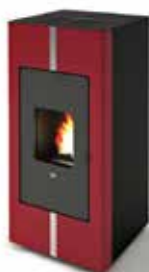
022 043 031 Stufa Idro Hydro Tosca 24 Kw Rosso o Avorio Eva Calor