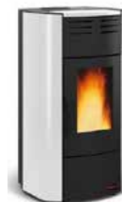
022 047 061 Stufa Idro Extraflame Raffaella Idro 2,0 Bianca Kw 19 H2o Kw 15,5