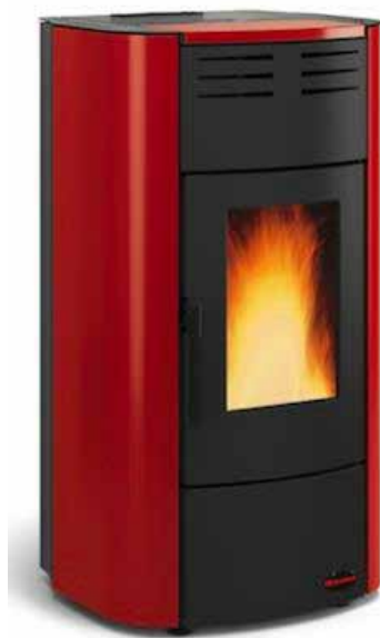
022 047 060 Stufa Idro Extraflame Raffaella Idro 2,0 Bordeaux Kw 19 H2o Kw 15,5