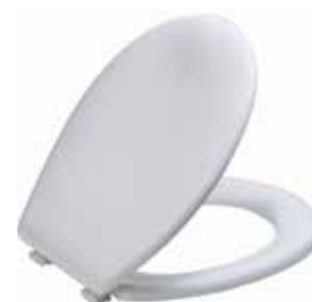
005 033 001 Sedile Universale in Pvc Pesante Cerniera Nylon Beu Kati Ideal Stand