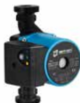
002 071 013 Elettropompa di Circolazione Alta Efficienza NMT PLUS 32/80-180 Imp