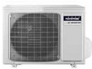
023 185 021 Climatizzatore Toyotomi 18000 Btu Multipit 2 At. Un.Est. MFMR3218INV2 2165,100