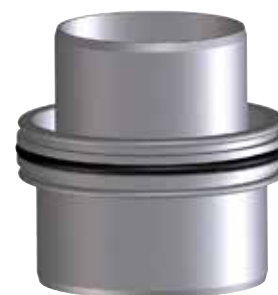
007 011 015 Riduttore DN75/90 HL990 25,700