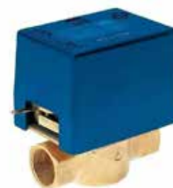
019 091 022 Valvola di Zona Motorizzata 2 Vie D.1/2X2 Vie Femmina 230V 177,100