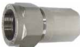
001 170 210 Raccordo di Riparazione Femmina per Tubo Zincato D.1'1/2 x1'1/2 29,700