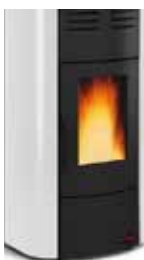
022 047 062 Stufa Idro Extraflame Raffaella Idro 2,0 Grigio Luce Kw19 H2o Kw15,5 6.533,80