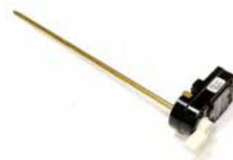
001 107 013 Termostato Scaldacqua Ariston Lungo Univ.Grand.Litr. Themowatt3412074 22,000