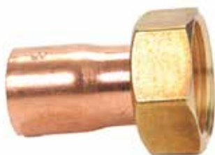
019 041 185 Raccordo in Rame a Saldare Girello Codulo Femm.Femm. D.111/4X35 24,700