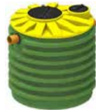
026 187 050 Serbatoio Polietilene da Interro IMHOFF 500 Lt75+411 A.E.2 Fognatura 696,200