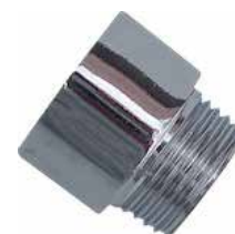
001 170 324 Raccordo Ottone Cromato Prolunga Maschio Femmina D.3/4x100 Cm 10,000