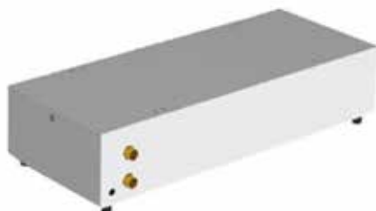
012 139 031 Accumolo Inerziale Installazione Sotto Unità Esterna Riscald./Raffresc. CKZ 50HH