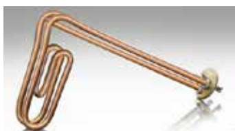
001 107 030 Resistenza Scaldacqua Chaffoteaux 15/30lt Watt1200 Themowatt 3401943