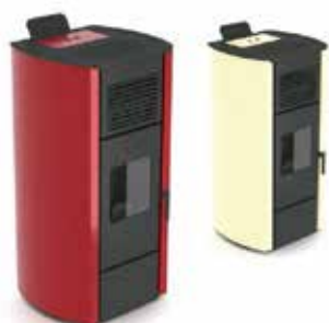
022 043 012 Stufa ad Aria a Pellet Eva Stampaggi Nicole Rosso/Avorio Kw 15