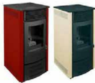
022 043 011 Stufa ad Aria a Pellet Eva Stampaggi Sara Rosso/Avorio Kw 13