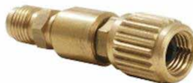
030 186 057 Raccordo a 3 pezzi 5/16"M-3/8"F 934075 MGF