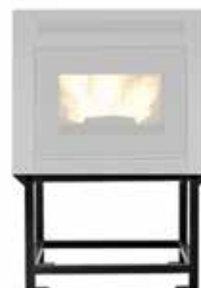
022 047 075 Kit Supporto Confort Idro L80 Extraflame