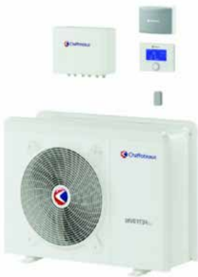
012 139 002 Pompa di Calore Inverter Monoblocco Lite Aria/Acqua Risc.Raffr. 70M LINK 7.624,70