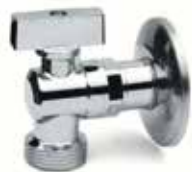
001 094 093 Rubinetto Lavatrice Silver con Levetta Cromato e Rosone D.1/2x3/4