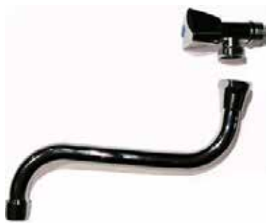
011 006 014 Rubinetto Lavello a Parete Canna Inferiore Leggero D.1/2 14,400