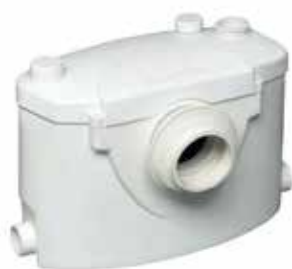
002 087 006 Mini Stazione di Sollevamento per Acque Sporche wc BROYSAN 4 Planus