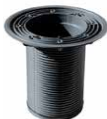
007 011 087 Prolunga Flangiata HL8500 per impermeabilizzazione 200 mm/ D146mm O-R 86,000