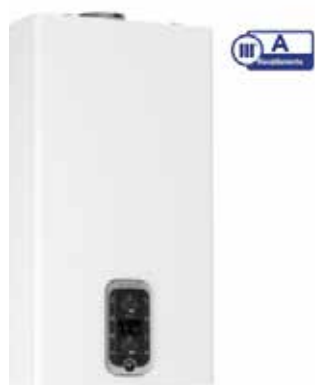
016 139 156 Caldaia a Condensazione Mira Advance 25 Kw FF Metano/Gpl 2.677,00 016 139 157 Caldaia a Condensazione Mira Advance 30 Kw FF Metano/Gpl 3.087,20 016 139 145 Caldaia a Condensazione Mira Advance 35 Kw FF Metano/Gpl 3.261,30