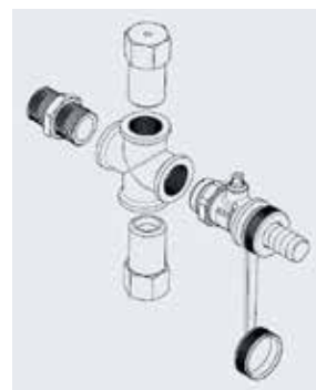
012 139 012 Kit Exogel Unità Esterna Pompa Calore 3318771