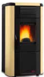
022 047 026 Stufa ad Aria a Pellet Extraflame Viviana Plus Evo Pergamen. Kw10,3A+