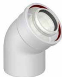
016 139 093 Curva Gomito Coassiale per Condensazione D.80/125 a 45° 3318037 Pz 1 0,000