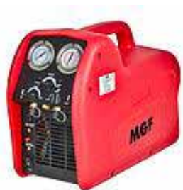
030 186 077 Recuperatore Gas R32 e Riciclaggio MGF 931091 Pressostato max 35/40