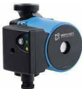
002 071 017 Elettropompa di Circolazione Alta Efficienza NMT PLUS 25/60-130 Imp