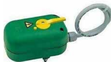
019 144 128 Servocomando per Valvola Motorizzata Far Small 230V SbloccoT.Rot.20'