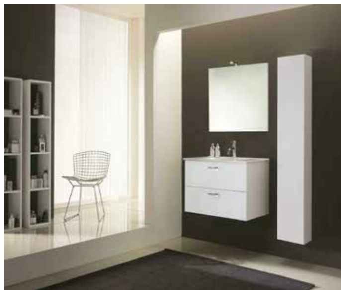
017 117 057 Mobile Bagno Sospeso 2 Cassettoni Specchio Cm L81xH190P47 Bianco Luc. 402,20