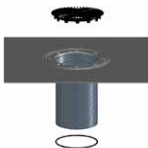
007 011 078 Prolunga HL8500H C/Guaina Bituminosa Incl.O-ring per HL3100/HL5100T 117,500