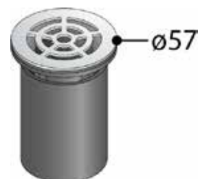
007 124 068 Griglia in Ottone Cromato per Pilette Plat.Doccia D.57 Tea 119.910.0 11,500