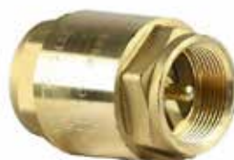
006 165 049 Valvola Ritegno Europa D.3" York