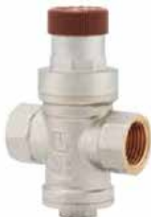
001 165 100 Riduttore di Pressione Minipress Itap Acqua Sotto Boiler 15bar D.1/2