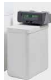
002 087 230 Addolcitore Pentair Riversoft 4 Lt 3,5 SA01WKW06A368-001 SenzaBypass