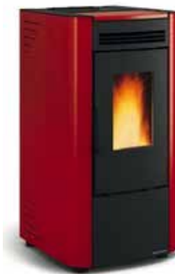
022 047 001 Stufa ad Aria a Pellet Extraflame Ketty Evo Bordeaux Kw 6,5 A+ 2.164,10