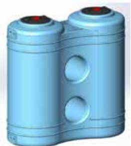
026 187 075 Serbatoio Polietilene Monoblocco Lineare J 2000 Lt Rototec 995,400