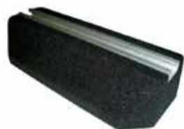
012 139 013 Vaschetta Unità Esterna Pompa Calore 3024383