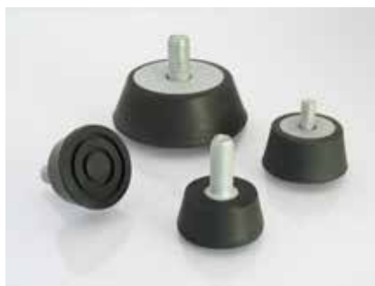
012 139 010 Piedini Antivibranti Sotto Unità Esterna (2 P) Pompa Calore 3078097