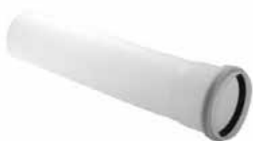
016 139 202 Tubo Prolunga per Condensazione D.60 x L 1000 PPS 3318105 43,800