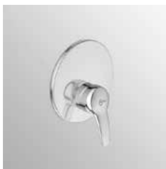
011 033 023 Miscelatore Monocomando Doccia Incasso Alpha Ideal Standard A7184AA 84,30