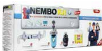
002 093 005 Nembo Kit Z Gel Dima Neutralizzatore Dosatore Defangatore Inibitore