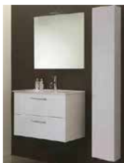
017 117 067 Colonna Singola Sospesa Rovere Mobile Bagno L25xH160P22 Bianco Lucid 223,500