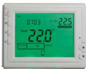
019 043 010 Cronotermistato Ambiente Digitale a Parete Giornaliero Settim.Bravo