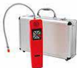
030 186 072 Cercafughe High Grade LT con Valigetta MGF 932296