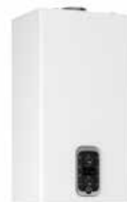
016 139 166 Caldaia a Condensazione Mira Advance Link 35 Kw FF Metano/Gpl 4273,300