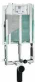
009 076 005 Cassetta Incasso Pucci Tsv Eco Rapido 6Lt-3 Lt 1322490201 con canotto 308,80