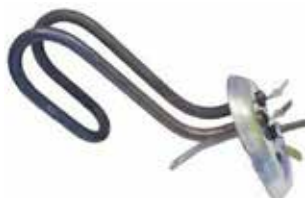
001 107 036 Resistenza Scaldacqua Chaffoteaux 30 Lt Watt 1500 Themowatt 3401161