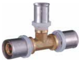
001 001 541 Raccordo Tubo Multistrato Pressare Tee Intermedia Rid. D.20x26x20x3 22,100