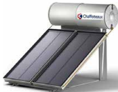
029 139 005 Sistema Solare Naturale Kit CF-2 Collettore Verticale Telaio Terra Bollitore Lt300-2 3.398,00