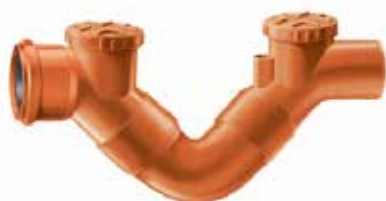
009 070 305 Sifone Firenze Pvc Rosso 2 Tappi ad Incollaggio D.140 62,200