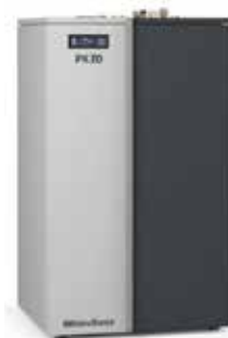
022 047 080 Caldaia a Pellet Extraflame PX 20 Kw 20 H2o Kw 20 A+