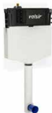
009 022 400 Cassetta Incasso Tropea S (6/3pre-reg.4,5/3,4/2) Solo Cassetta Valsir 194,90