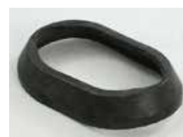
003 101 010 Guarnizione per Resistenza Flangiata Scaldacqua Autoclavo 180718