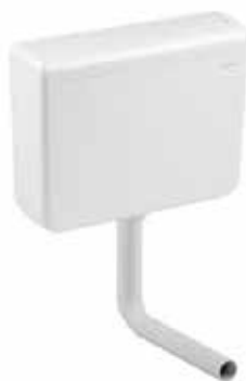
009 034 020 Cassetta a Zaino Coibentata Iris Mono Funzione Start-Stop SCHWAB 31,30