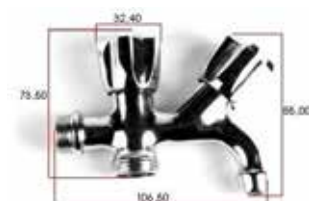
011 006 010 Rubinetto Lavatrice Doppio Uso Leggero D.1/2 18,300