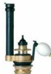
001 156 004 Unibox Pulsante Centrale Its Todini 5,06