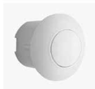
009 169 025 Pulsante Pneumatico da Incasso Bianco Oli OL0605001 26,000