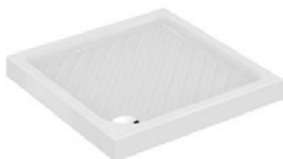
024 033 098 Piatto Doccia Gemma 2 70x70 H7 Bianco Ideal Standard art.J526001 155,10