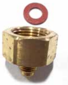
030 186 063 Raccordo Senza/Depressione 1/2" Gas F-1/4" M SAE 934092 MGF