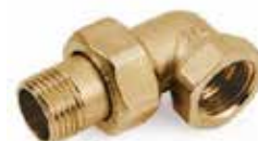
001 041 230 Raccordo Ottone Giallo Gomito Bochettone 3 Pz Maschio Femmina D.1/2 6,400