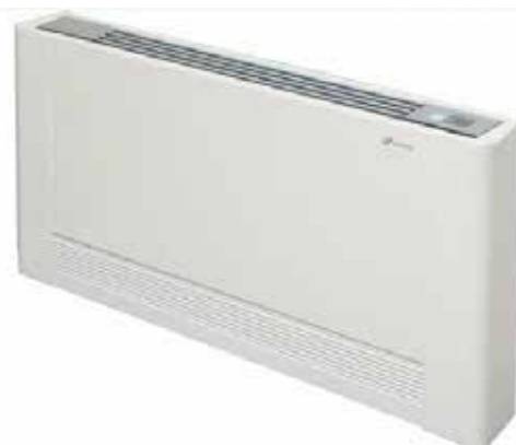
012 188 005 Ventilconvettore Fan-Coil Slim Dc Inverter Parete con Aspirazione Inferiore SL1000C