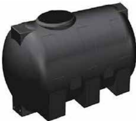
026 187 040 Serbatoio Polietilene da Intero Cisterna Lt 1000 OC1000 Rototec 658,50