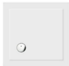
024 042 042 Piatto Doccia Acrilico Quadrato 76x76 B/co Clear Green A7676 Antib. 182,100