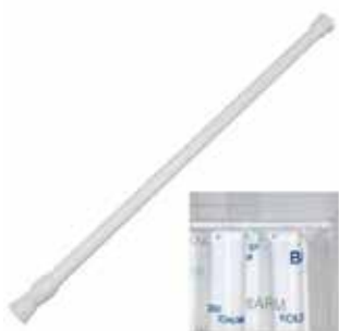
013 024 002 Telaio per Doccia o Vasca Estensibile Cm 80 x 135 Dritto Bianco 20,200