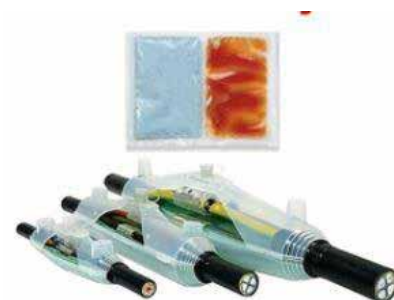
002 048 030 Muffola Kit Giunti Resina 9-50 mm 32,900