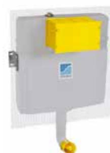
009 034 001 Cassetta Incasso UP 199 SCHWAB Doppio Flusso 3/6 L(4-7) Solo Cassetta 121,90