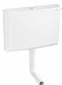
009 034 023 Cassetta a Zaino Coibentata Slim Funzione Start-Stop SCHWAB 83,70