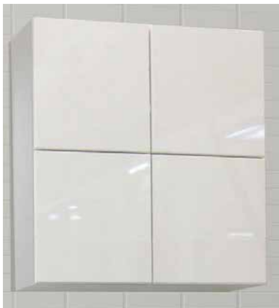
017 117 110 Pensile con 4 Ante Apertura Pusc And Pull Cm L71xH71P22 Bianco Luc. 199,10