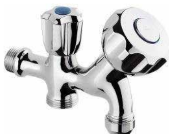
011 003 037 Rubinetto Lavatrice Doppio Uso Pesante D.1/2 art.34 26,000