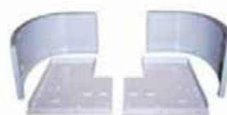
012 188 014 Piedini Ancoraggio a Pavimento Innova LC0605III Ral 90003