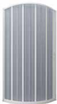
010 174 013 Box Doccia in Pvc a Soffietto H185 Sfera Centrale Cm 90-90 Eco free 247,200