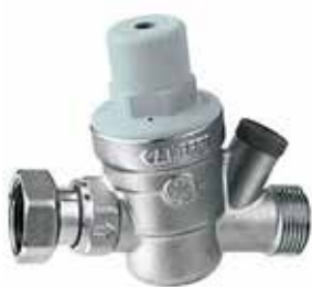
012 139 011 Kit Valvole e Filtro Unità Esterna Pompa Calore (2 P) 3083059