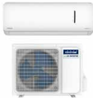
023 185 053 Climatizzatore Toyotomi Satori 24000 Btu Monopit Inv.STN/STG-924R32 2520,500