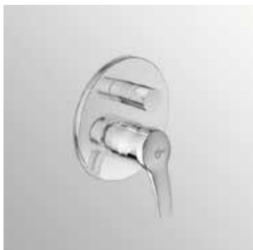
011 033 025 Miscelatore Monocomando Incasso Vasca/Doccia Alpha Ideal Standard A7185AA