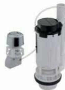
009 034 015 Valvola di Scarico 550 SCHWAB per Monoblocco 31,300