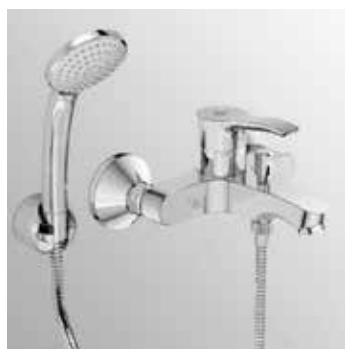
011 033 022 Miscelatore Monocomando Vasca Esterno Alpha Ideal Standard BC676A 167,80