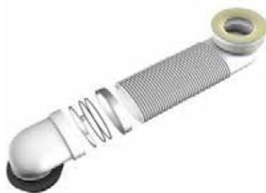
009 022 269 Curva Wc OFFSET Regolabile in Lunghezza PP D.80/110F-100/110M Bonomi 47,100