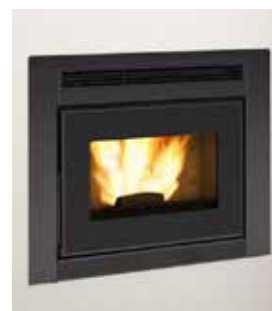
022 047 070 Inserito Comfort Idro L80 Extraflame Kw 19 H2o Kw 14,9 A+