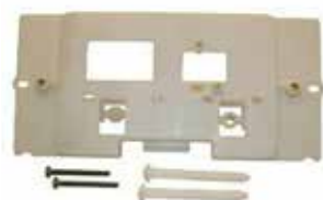
009 076 030 Ricambi Pucci Eco Sportello Completo 80005541 C/2Vite Registro D.M8 72,70