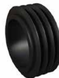
003 006 034 Morsetto per Curva Tecnica Scarico Nero C/Aletta D.55x40 Bonomini