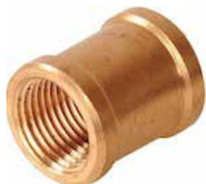
001 170 203 Raccordo Ottone Giallo Manicotto Ridotto FF D.3/8 x1/4 1,700