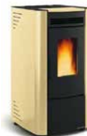
022 047 002 Stufa ad Aria a Pellet Extraflame Ketty Evo Pergamena Kw 6,5 A+