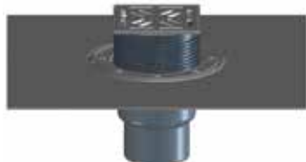
007 011 086 Pozzetto Balconi Terrazzi HL3100TH DN75 Verticale C/ Guain.Bituminosa 248,900