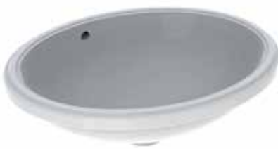
024 118 021 Lavabo d'Arredo Incasso Sottopiano VariForm Pozzi Ginori Bianco 50x40 201,30