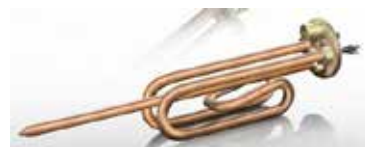
001 107 032 Resistenza Scaldacqua Chaffoteaux 15/30lt Watt1200 Themowatt 340103501