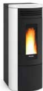
022 047 051 Stufa Idro Extraflame Costanza Idro Bianca Kw 17 H2o Kw 12