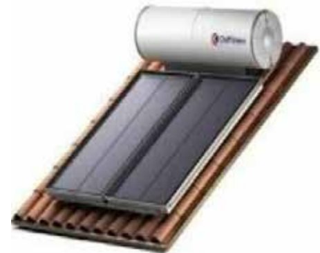
029 139 006 Sistema Solare Naturale Kit CF-2 Collettore Verticale Telaio Tetto Bollitore Lt300-2 3.398,00