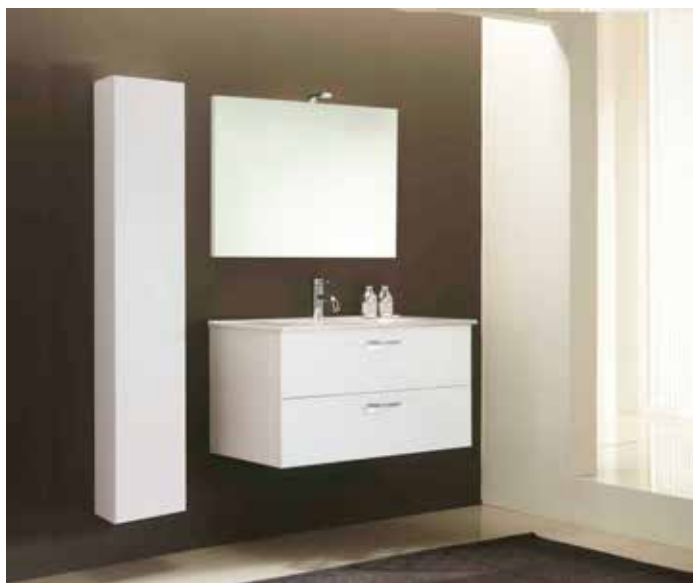
017 117 058 Mobile Bagno Sospeso 2 Cassettoni Specchio Cm L101xH190P47 Bianco Luc. 459,10