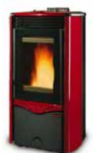
022 047 040 Stufa Idro Extraflame Duchessa Idro Steel Bordeaux Kw 12 H2o