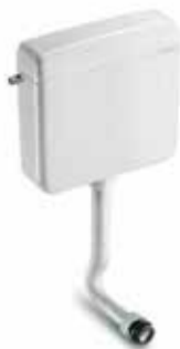
009 076 007 Cassetta Zaino Pucci Viva Esterna 9 Lt Puls con Stop 77000000 con Canotto 87,40