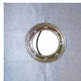
007 011 088 Kit per impermeabilizzazioni HL8300.M guaina con superficie in vello 107,500