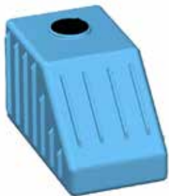
026 187 060 Serbatoio Polietilene Sottoscala Lt 500 Rototec SS500 418,100