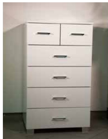
017 117 101 Cassettiera con 4+2 Cassettoni Piedini Triangolari Cm L60xH104P44 Bianco Luc. 243,80