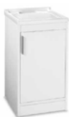
017 084 080 Mobile Lavatoio in Acrilico Resina Avant Standard L45xP50xH84 Ante 1 182,900