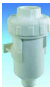
002 093 020 Neutralizzatore di Condensa Neutrofil Mini D.3/4" WLNCMINI