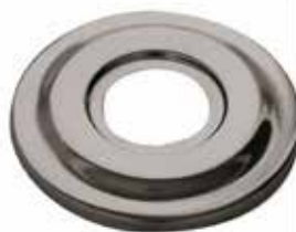
001 172 015 Rosetta per Rubinetto Tonda Tipo Sagomato Ottone Cromata D.1/2 mm 60 0,900