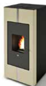
022 043 030 Stufa Idro Hydro Tosca 20 Kw Rosso o Avorio Eva Calor