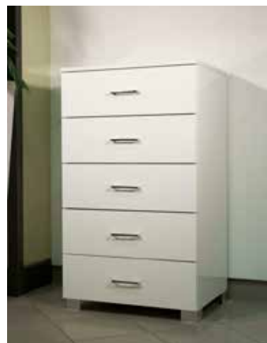
017 117 100 Cassettiera con 5 Cassettoni Piedini Triangolari Cm L60xH104P44 Bianco Luc. 223,50