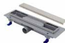
009 034 050 Canaletta Doccia Filo Pavimento Telaio Acciaio 350 mm Griglia Standard 162,60