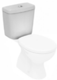
024 033 082 Cassetta Quarzo per Vaso Sc.Pav.B/CO Entr.Bassa Ideal Stand.E885001 185,200