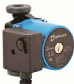
002 071 010 Elettropompa di Circolazione Alta Efficienza NMT SAN PLUS 25/40-130 Imp