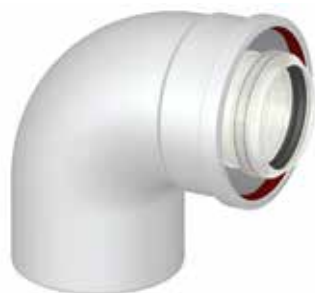
016 139 092 Curva Gomito Coassiale per Condensazione D.80/125 a 90° 3318036 Pz 1 0,000