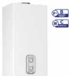
016 139 159 Caldaia a Camera Aperta Pigma 30 Ultra CF EU Metano Chaffoteaux 3310638 2.306,80