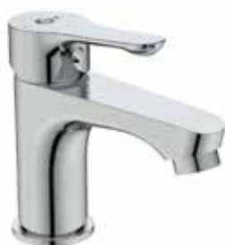
011 033 020 Miscelatore Monocomando Lavabo Alpha Ideal Standard BC647AA con Scarico 104,70