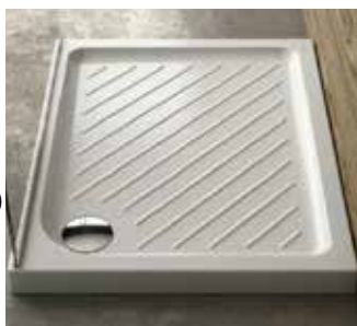
80x80 024 033 100 Piatto Doccia square 80x80 H7 Bianco Ideal Standard art.3025301 203,70