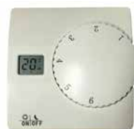
019 023 006 Termostato Ambiente Meccanico con Display Digitale C/interut. On-Off 35,000