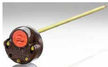
001 107 020 Termostato Scaldacqua Universale Tondo Themowatt cod.3412105