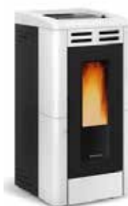
022 047 030 Stufa ad Aria a Pellet Extraflame Anastasia Plus Evo Bianca Kw 12 A+