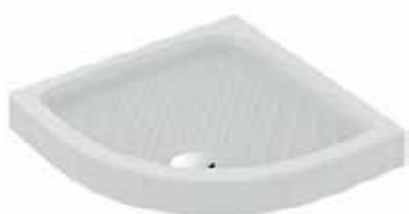
024 033 120 Piatto Doccia Ang.Gemma 2 cm 80x80 H7 Bianco Ideal Standard art.J526401 314,60