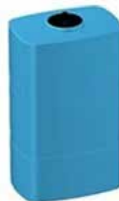
026 187 071 Serbatoio Polietilene Verticale 535 OR500 Rototec 435,200