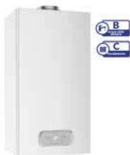
016 139 176 Caldaia a Camera Aperta Inoa Ultra 25 Kw CF Metano Chaffoteaux 3310639 1.554,00