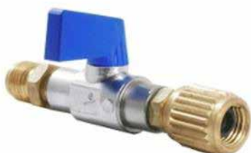
030 186 062 Rubinetto Depressione 1/4" F-5/16" M(B) 934088 MGF