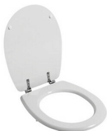
005 175 011 Sedile Universale Chiuso in Legno Vaso Disabile Anziano Terza Età