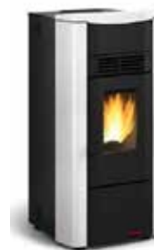
022 047 011 Stufa ad Aria a Pellet Extraflame Giusy Evo Bianca Kw 7 A+