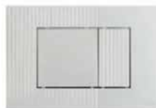
009 034 008 Placca Metis Cromo Lucido Cassetta Incasso SCHWAB Doppio Flusso 3/6 44,70