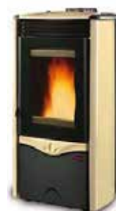
022 047 041 Stufa Idro Extraflame Duchessa Idro Steel Pergamena Kw 12 H2o Kw10,8