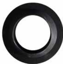
009 169 021 Guarnizione Conica per Scar. Cassette Alte Ceramica Replace/Delux Oli 7,300