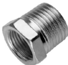
001 099 086 Raccordo Acciaio Zincato Riduzione MF Fig.241 D.1'x3/8 1,400