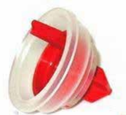
009 077 027 Ricambio Cassetta Grohe 4375800M Membrana Valvola Carico Pz 10 90,500