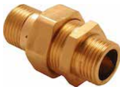
001 041 202 Raccordo Ottone Giallo Bochettone 3 Pz Maschio Maschio D.3/8 4,500