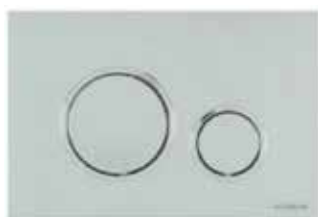
009 034 006 Placca Vela Cromo Lucido Cassetta Incasso SCHWAB Doppio Flusso 3/6 44,70