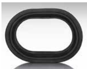
003 101 011 Guarnizione per Resistenza Flangiata Scaldacqua Lati Piegati 180716