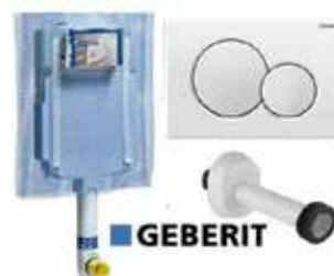
009 078 005 Cassetta Incasso Geberit Sigma8 Cassetta Completa Placca e Canotto 373,60