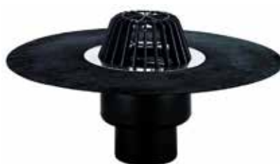
007 011 079 Pozzetto Terrazzi HL62H/1 DN110 Griglia Plast.Rac.Foglie Fogli.Bitumi 199,800