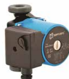
002 071 016 Ricambio di Circolazione Tre Velocità GHN25/60-130 IMP 979521703