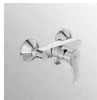
011 033 024 Miscelatore Monocomando Doccia Esterno Alpha Ideal Standard BC488AA 111,40