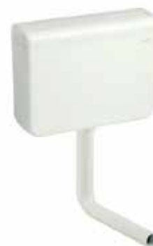
009 034 021 Cassetta a Zaino Coibentata Iris Duo Comando Doppio Tasto SCHWAB 41,50